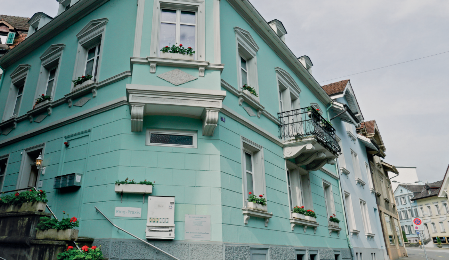
Die Praxis gibt es in Olten bereits seit langer Zeit.